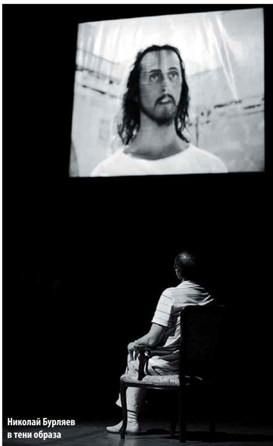
Николай Бурляев в тени образа