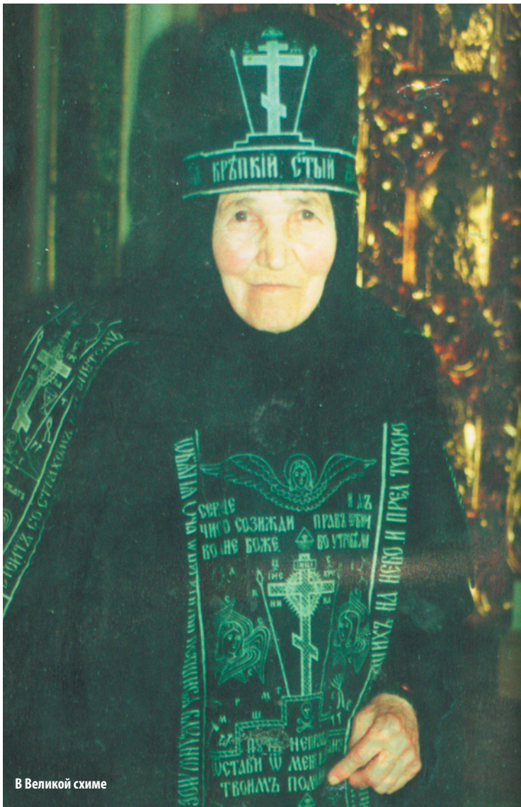
В Великой схиме