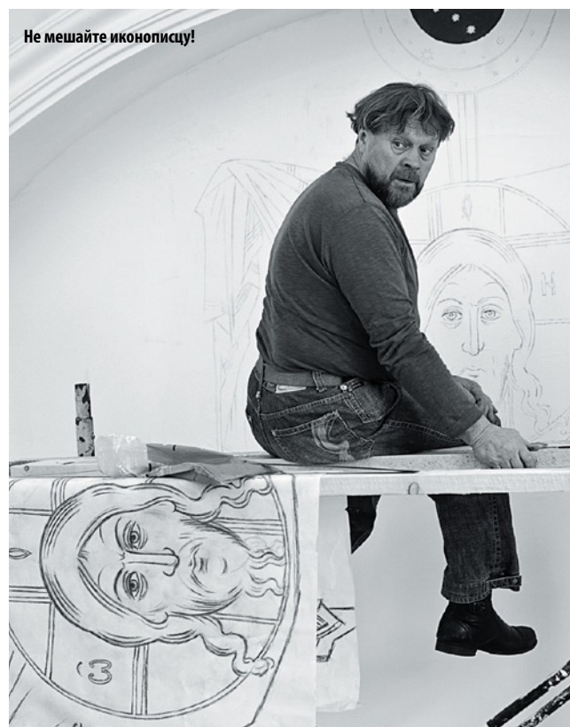
Не мешайте иконописцу!