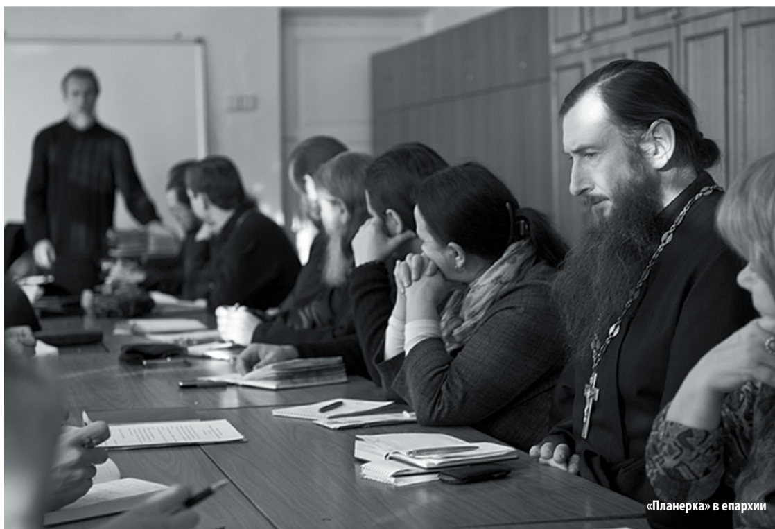
«Планерка» в епархии